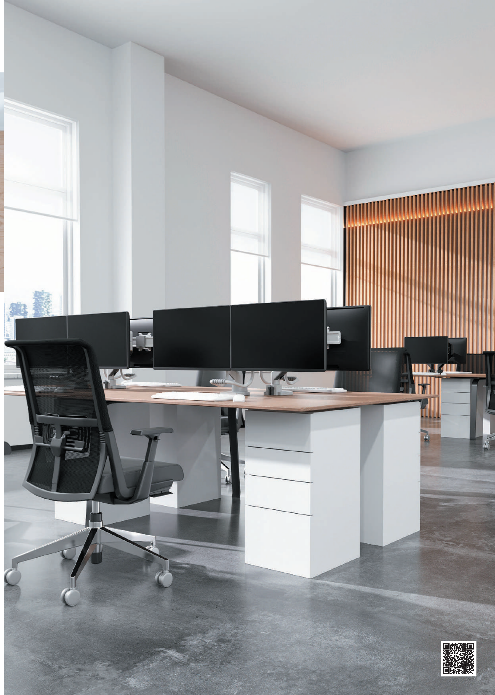
DS75-450BL2 / WH2 Bildschirmgröße: 17-32" Kapazität: 8 kg (2x)