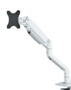
DS70S-950BL1 / WH1 Bildschirmgröße: 17-49" Kapazität: 18 kg (Curved 15 kg) Verstärkter Kopf