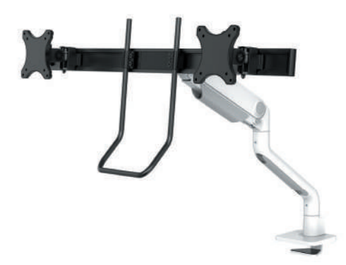
DS75S-950BL2 / WH2 Bildschirmgröße: 17-27" Kapazität: 8 kg (2x) Großes Cockpit-Setup möglich