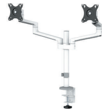
DS60-425BL1 / WH1 Bildschirmgröße: 17-27" Kapazität: 8 kg