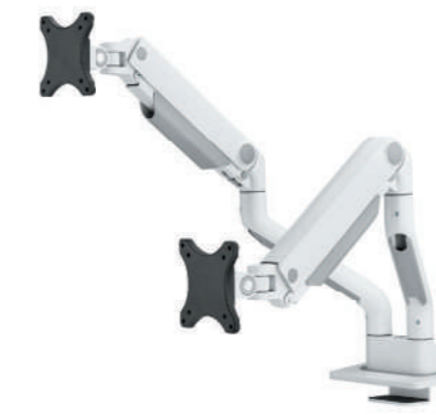
DS70S-950BL2 / WH2 Bildschirmgröße: 17-35" Kapazität: 18 kg (2x) Verstärkter Kopf